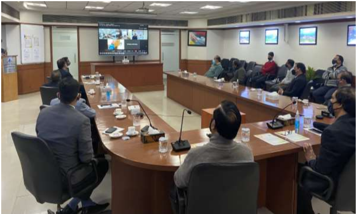
ADDRESS OF CMD ON THE OCCASION OF CELEBRATION OF “ICONIC WEEK OF AZAADI KA AMRIT MAHOTSAV” (AKAM) 10TH JANUARY 2022