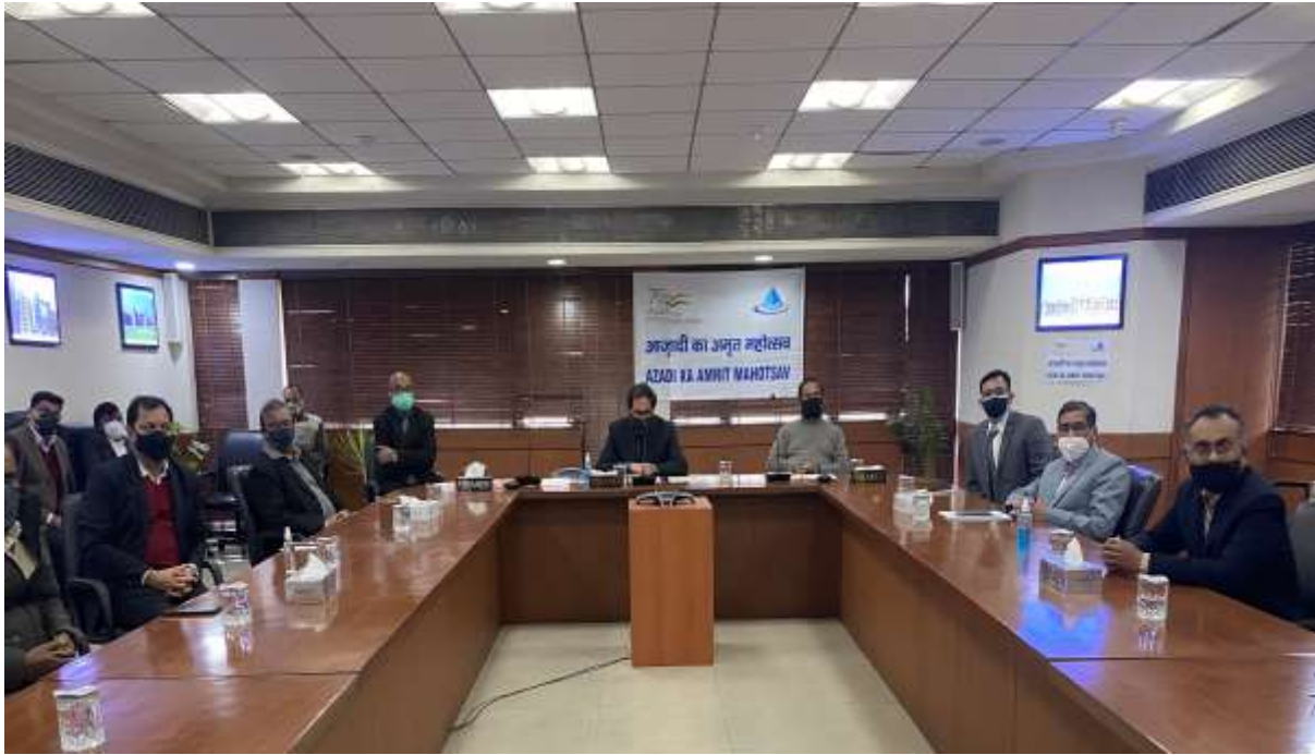
CMD & DIRECTOR (PROJECTS) ON THE OCCASION OF CELEBRATION OF “ICONIC WEEK OF AZAADI KA AMRIT MAHOTSAV” (AKAM)