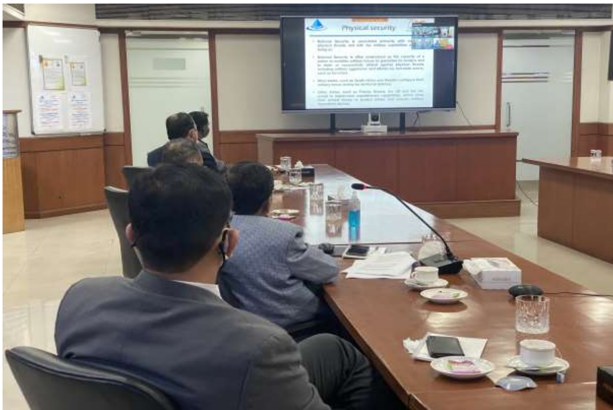
WEBINAR ON NEW IDEAS OF BORDER FENCING WITH MODERN TECHNOLOGIES ON THEME “NATIONAL SECURITY” ORGANIZED THROUGH VIDEO CONFERENCING BETWEEN CORPORATE & REGIONAL OFFICES ON THE OCCASION OF CELEBRATION OF “ICONIC WEEK OF AZAADI KA AMRIT MAHOTSAV” (AKAM) 10TH JANUARY 2022