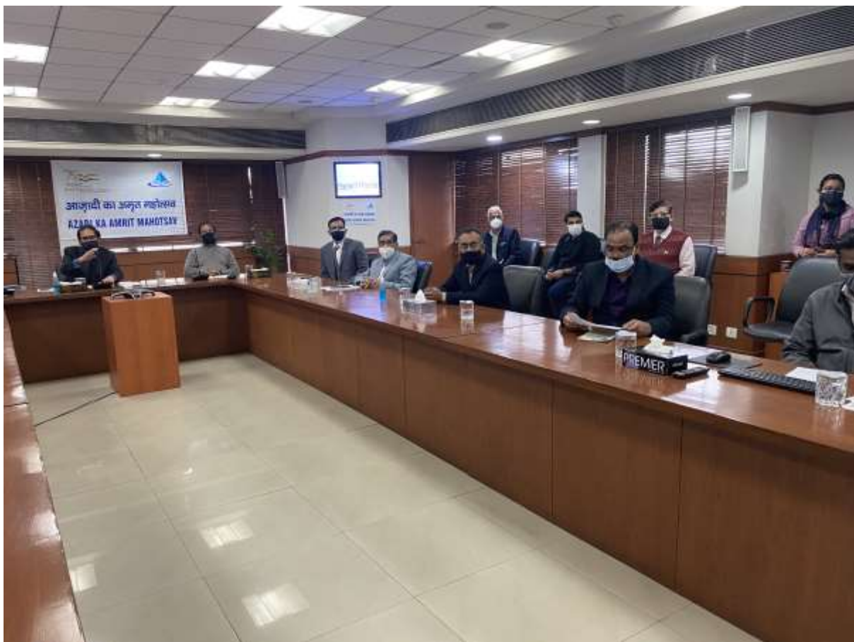
EPI OFFICIALS ON THE OCCASION OF CELEBRATION OF “ICONIC WEEK OF AZAADI KA AMRIT MAHOTSAV” (AKAM)