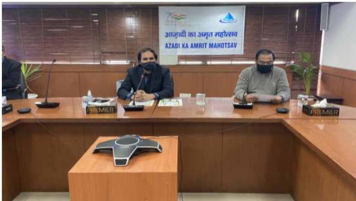
DIRECTOR (PROJECTS) READ OUT THE JOINT SPEECH (HINDI) OF HON'BLE MINISTER OF MIN. OF HI & PE AND HON'BLE MINISTER OF STATE FOR MIN. OF HI & PE ON THE OCCASION OF CELEBRATION OF "ICONIC WEEK OF AZAADI KA AMRIT MAHOTSAV" (AKAM)