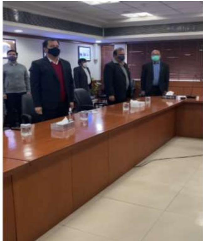
RASHTRAGAAN ON THE OCCASION OF CELEBRATION OF “ICONIC WEEK OF AZAADI KA AMRIT MAHOTSAV” (AKAM)