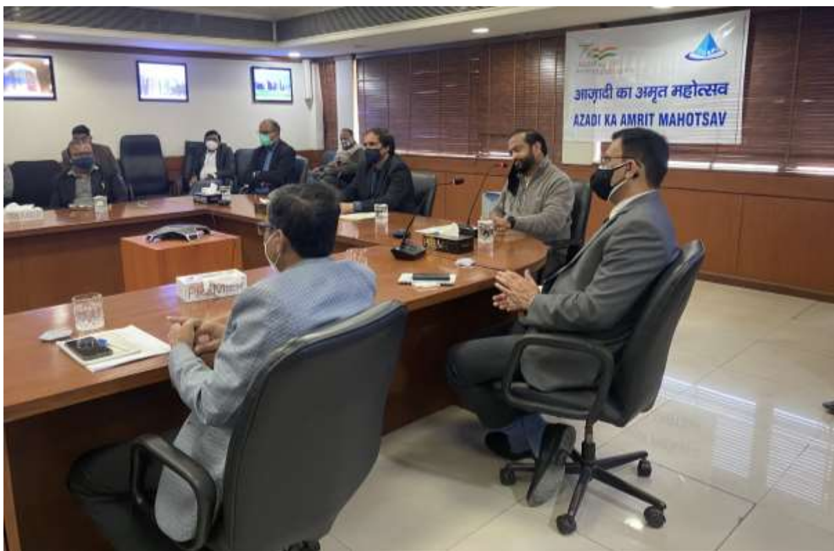
ADDRESS OF DIRECTOR (PROJECTS) ON THE OCCASION OF CELEBRATION OF "ICONIC WEEK OF AZAADI KA AMRIT MAHOTSAV" (AKAM) 10TH JANUARY 2022