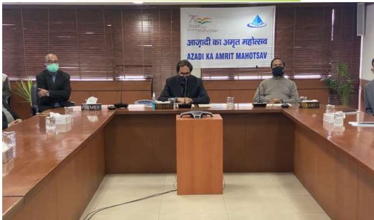
CMD READ OUT THE JOINT SPEECH (ENGLISH) OF HON'BLE MINISTER OF MIN. OF HI & PE AND HON'BLE MINISTER OF STATE FOR MIN. OF HI & PE ON THE OCCASION OF CELEBRATION OF "ICONIC WEEK OF AZAADI KA AMRIT MAHOTSAV" (AKAM)